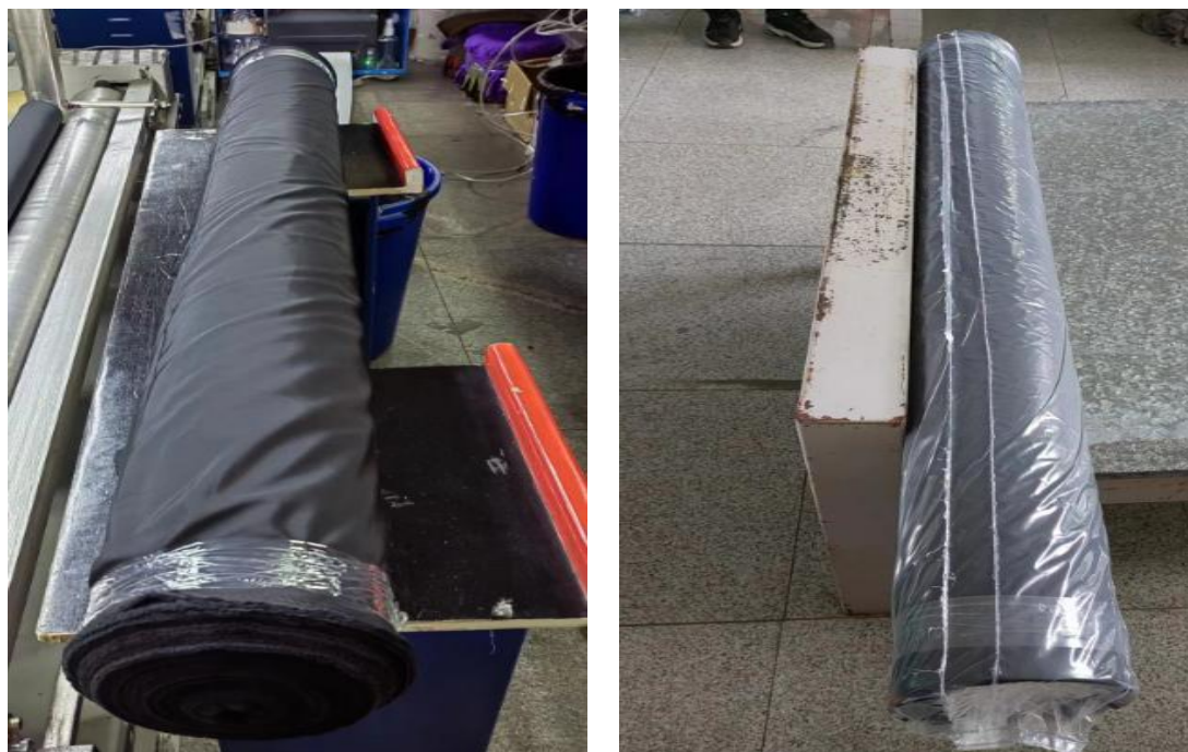
图 3.2.1 消光桃皮高密布产品图