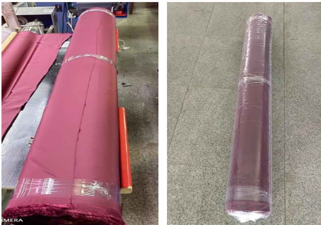
图 3.1.1 缎面全捻仿记忆布产品图